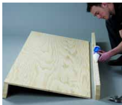
Ξεκινήστε συναρμολογώντας τη βάση του κρεβατιού με τα δύο πλαισιά. Βάψτε κόλλα στα πλαισιά.