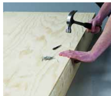
Τοποθετήστε την βάση του κρεβατιού πάνω στα πλαισιά και καρφώστε με ακέφαλα βελονάκια.