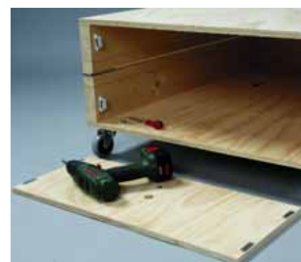
Ανοίξτε μία τρύπα 20 χιλ. στη μέση του καπακιού και βιδώστε τα 4 μαγνητάκια στις γωνίες.