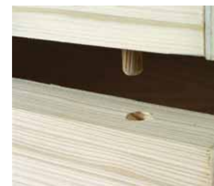
Ανοίξτε τις αντίστοιχες υποδοχές στο πάνω μέρος σε βάθος, που να αφήνει απόσταση 1 εκ.