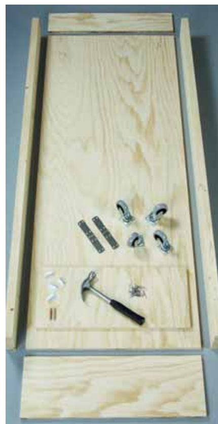
Αυτά είναι όλα τα υλικά, που θα χρειαστείτε για το πτυσσόμενο κρεβάτι.