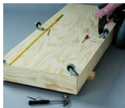
Βιδώστε από την κάτω πλευρά τα 4 ροδάκια με βίδες 4x16 χιλιοστά