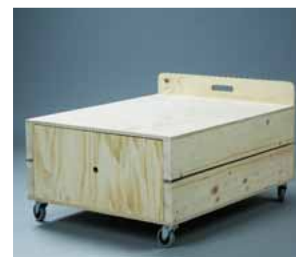
Τοποθετήστε το καπάκι στη θέση του και το κρεβάτι είναι έτοιμο για βάψιμο.