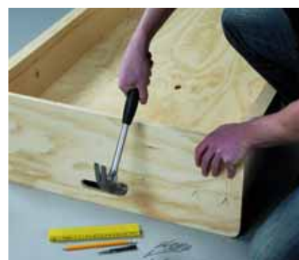
Βάψτε κόλλα στις γωνίες του κρεβατιού και καρφώστε τη σανίδα με ακέφαλα βελονάκια.