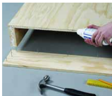
Βάψτε κόλλα στις ακμές του κρεβατιού, ώστε όταν μετά καρφώσετε, να είναι εντελώς σταθερό.