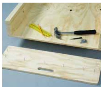
Η σανίδα είναι έτοιμη για καρφωμα. Καλό θα ήταν να έχετε προκαρφώσει τα βελονάκια.