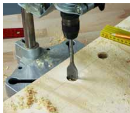
Ανοίξτε δύο τρύπες, 25 χιλιοστών η καθεμία, στη σανίδα για τη χειρολαβή.