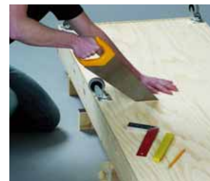
Τοποθετήστε το κρεβάτι οριζόντια και κόψτε το πέρα ως πέρα σε δύο μέρη. Σε αυτό το σημείο θα πρέπει να δώσετε ιδιαίτερη προσοχή, καθώς η έλλειψη ακρίβειας μπορεί να καταστρέψει την κατασκευή.