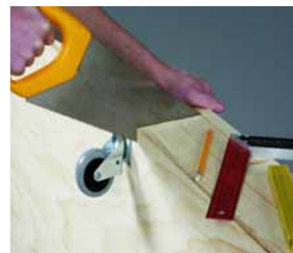
Κόψτε το κρεβάτι στα δύο με χειροπρίνο. Γυρίστε το κρεβάτι στο πλάι και κόψτε το μέχρι την μέση.