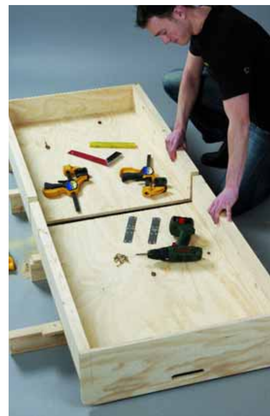
Τοποθετήστε τα δύο μέρη σε κάποια απόσταση το ένα από το άλλο.