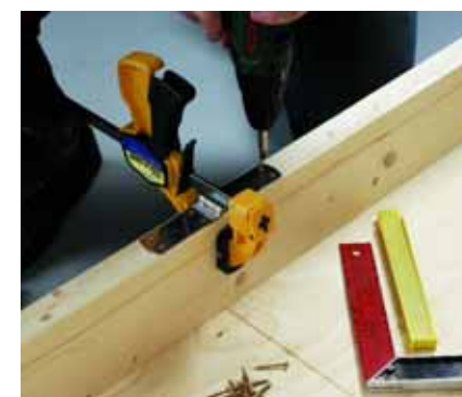
Συγκρατήστε τα δύο μέρη με σφικτήρες επίπεδα και βιδώστε τους μεντεσέδες με βίδες 4x35 χιλ.