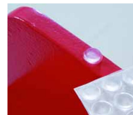
Τοποθετήστε προστατευτικά πλαστικά πατάκια στην ακμή που ακουμπάει στο δάπεδο.