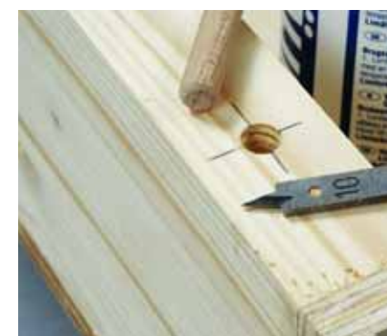
Με τρυπάνι 10 χιλ. ανοίξτε τρύπες βάθους 1 εκ. για τις καβίλιες σε κάθε πλευρά, 5 εκ. από τις ακμές.