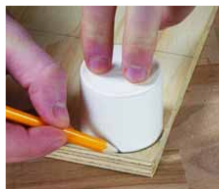
Σχεδιάστε τα στρογγυλεμένα τμήματα των γωνιών και κόψτε τα με την σέγα προσεκτικά.