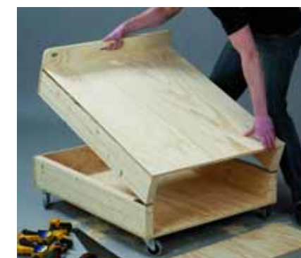
Όταν οι μεντεσέδες βιδωθούν και σταθεροποιηθούν, το κρεβάτι μπορεί να διπλωθεί στα δύο.