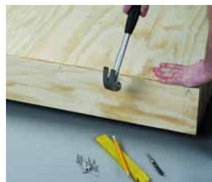
Καρφώστε στο κρεβάτι με ακέφαλα βελονάκια τη σανίδα του πάνω μέρους.